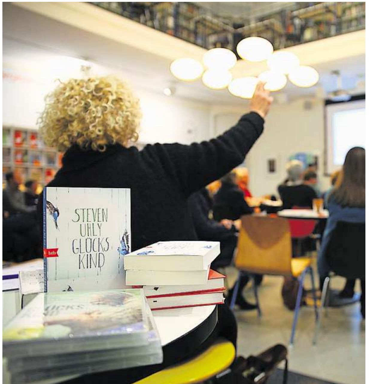
Im Herz der Bücherwelt: Die erste Informationsveranstaltung der Aktion „Regensburg liest ein Buch“ fand in der Stadtbücherei statt.